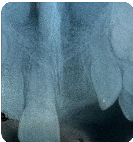
F.P. * 1993 (F). En 2000, accident en jouant au football. 21 avulsée et apportée en moins de deux heures au cabinet pour réimplantation. Conservation dans le lait.

Le projet SOS-DENTI a été présenté à l'occasion de l'assemblée de la SSO-Ticino en janvier 2019. SOS-DENTI fait partie d'une réflexion générale sur les lacunes de prévention et les marges d'action rencontrées dans plusieurs domaines. Appelé « Projet 15/18 », il vise à renforcer la protection des jeunes durant une période particulièrement vulnérable. En syn-