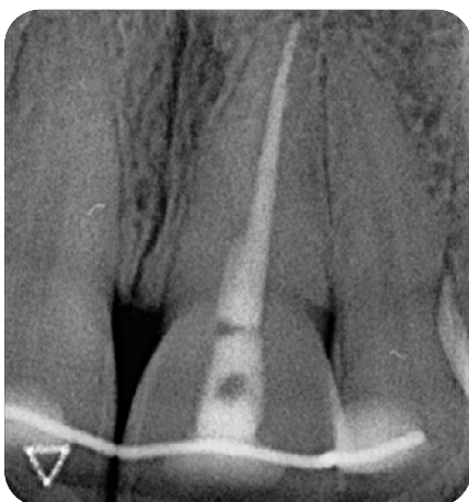
En 2023, radiographie 23 ans après l'accident

Pour terminer, sans la disponibilité remarquable de la Fondation Ticino Cuore