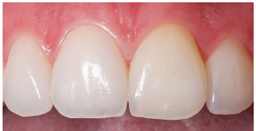
Le résultat 23 ans après l'accident. L'objectif de SOS-DENTI