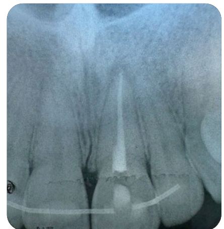
En 2016, après seize ans, il a été nécessaire de procéder à un traitement de racine.