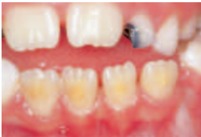
Abb. 1 7-jährige Patientin mit typischen posttraumatischen (Hypoplasien) Schmelzverfärbungen der labialen Kronenflächen aller Unterkieferinzisiven. Status nach lateraler Dislokation der Zähne 71, 72, 81 und 82 im Alter von 3 Jahren.