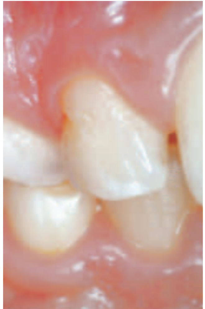
Abb. 2 10-jähriger Patient mit einem Schmelzdefekt distozervikal bei Zahn 12. Status nach lateraler Dislokation der Zähne 51 und 52 im Alter von 4 Jahren.

webskonglomerat ähnlich einem komplexen Odontom. Da auch die Wurzelbildung in diesen Fällen massiv gestört wird, brechen solche Zähne in der Regel nicht durch und müssen chirurgisch entfernt werden.