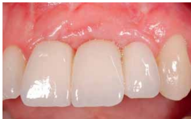
«In welchen Situationen sollte ich lieber die Finger davon lassen und den Patienten zum Spezialisten überweisen?» Die Korrektur ästhetischer Misserfolge hinterlässt meist trotz grösstem klinischen Aufwand kompromittierende Spuren.