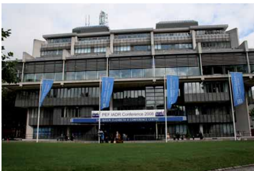
Der PEF IADR Kongress fand in der City von London statt ...