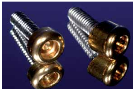
Abb. 1 Das Locator® Root Attachment (endodontischer Anteil im Schraubendesign und Locator® Attachment) als eine der besprochenen dental verankerten Retentionsmöglichkeiten von abnehmbaren Prothesen zur direkten Insertion.