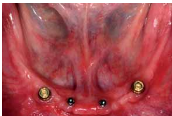
Abb. 2 Durchmesserreduzierte Implantate und deren Anwendung in der provisorischen oder definitiven Rekonstruktion.