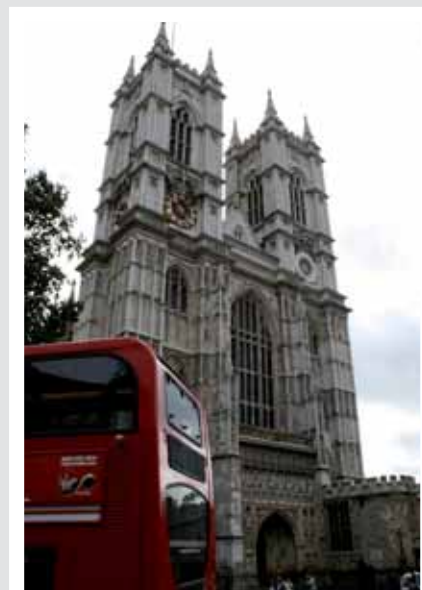
... direkt gegenüber von Westminster Abbey